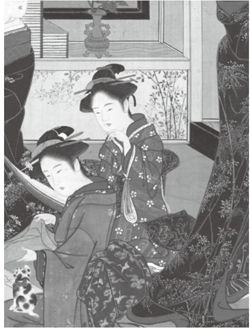
図5 美人鑑賞図(部分) 勝川春章 出光美術館