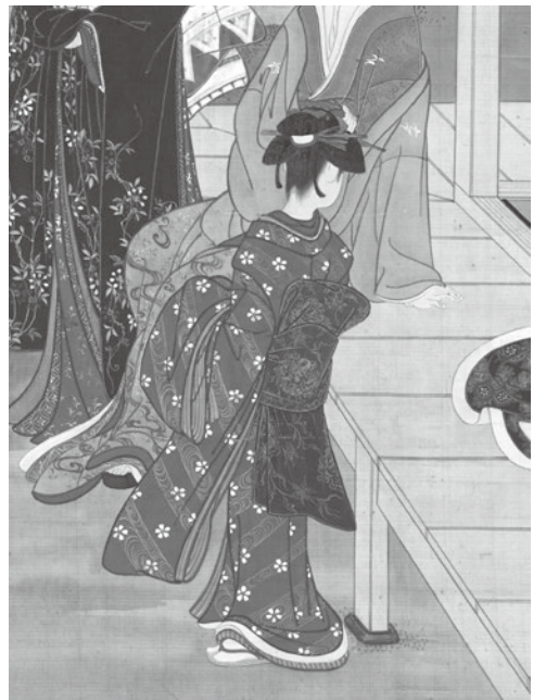
図6 美人鑑賞図(部分) 勝川春章 出光美術館

供した栄之の木版画にも、同じように二人の童女が含まれており、これを除けば七人の女性が描かれていた。その数もまた、栄之画面固有の主題を理解するために明確な意味を持ちうるものだが、春章は、画面のつくり方や人物の挙措について栄之画に強く依拠している一方で、人物の数を意識的に変更していることになる。その理由は、どこにあるだろう。