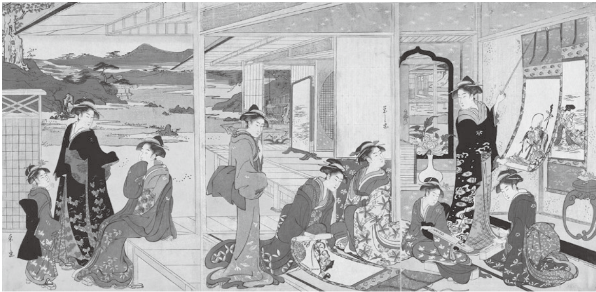
図2 福神の軸を見る美人 鳥文斎栄之 アメリカ・シカゴ美術館

とが判明する。村瀬氏は、さらに相互に摺りの状態を比較することによってシカゴ美術館の三枚続がボストン美術館の一枚に先行することを指摘するとともに、栄之画の署名形式に示される傾向から、シカゴ美術館の三枚続を寛政二年（一七九〇）ころの作であることを主張した。その後、発表された染谷美穂氏による精緻な栄之研究からも、村瀬氏の判断の妥当性は補強される〔註8〕。村瀬氏の考証の結果、内藤氏が導いた「美人鑑賞図」の制作年代の幅は、さらに狭まったわけである。