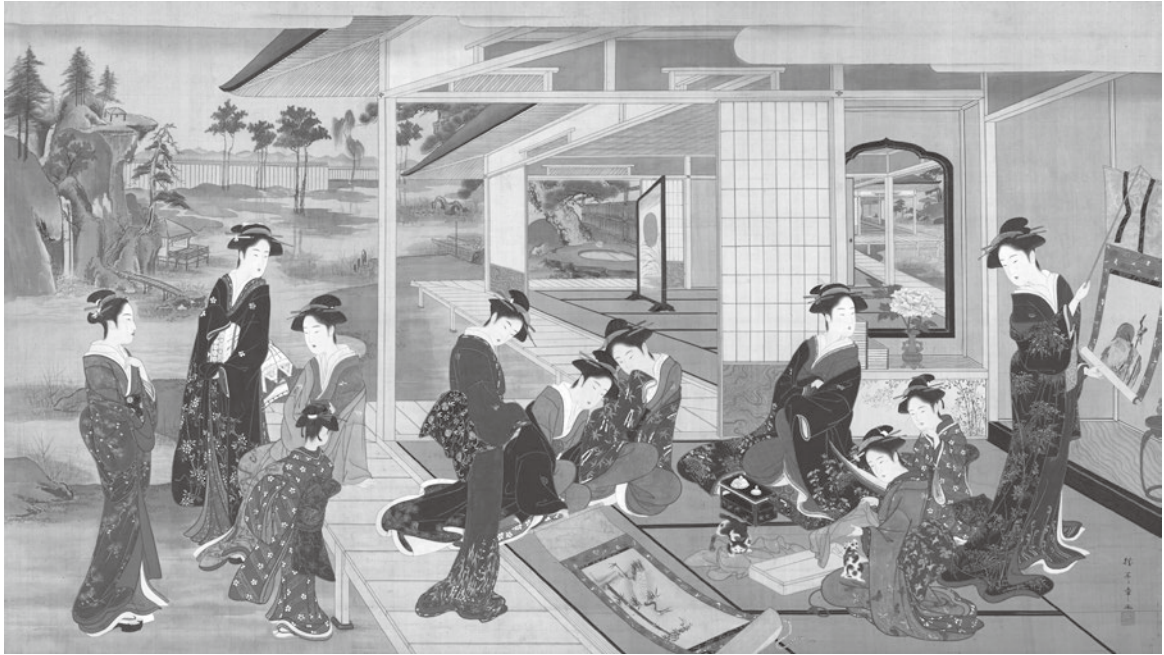
図1 美人鑑賞図 勝川春章 出光美術館