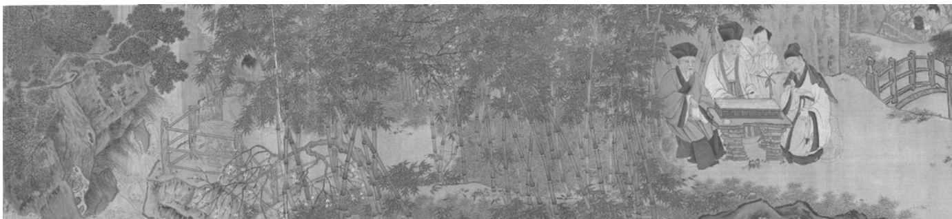
図7 九老図卷 劉松年 台湾・國立故宮博物院

享保九年郡山に生る。元安二年十一月三日嫡子となり、閏十一月朔日 （吉宗） はじめて有徳院殿にまみえたてまつる。〔時に十四歳〕三年二月二十三日帝鑑間に候すべき旨仰を蒙り、十二月十八日従四位下美濃守に叙任す。延享二年十月二十日遺領を継、席を帝鑑間にさだめらる。後代々おなじ。二十八日襲封を謝するとき家臣四人御前に出、のち例とす。三年六月十五日はじ