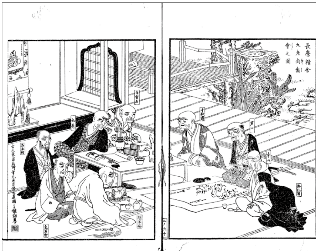
図8 尾張名所圖會（巻第2）

れている。「美人鑑賞図」の主題を理解する上で、なによりも重要なのがこのことだろう。『後素集』の香山九老図の項にも、参会した九人の