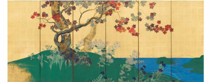
四季花木図屏風(左隻) 鈴木其一 江戸時代 出光美術館