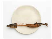
【木彫】前原冬樹「一刻・血に秋刀魚」2014年 個人蔵

17:30受付開始(三井本館1階アトリウム)/参加費無料(要別途入館料) 定員30名(先着順。当日10:00開館以降7階受付にて参加券配布)