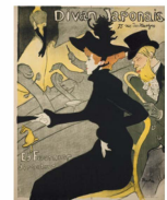
アンリ・ド・トゥールーズ＝ロートレック 《ディヴァン・ジャポネ》1893年 三菱一号館美術館

定員20名(先着順。メールにて事前申込。10.6(金)よりeventmitsubishi@mec.co.jpにて申込受付開始)