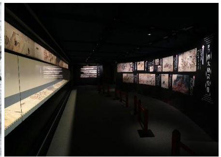
(活用) 過去の展示風景