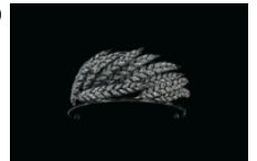
フランソワ=レニエール・ニト《妻の穂のティアラ》1810-11年頃 ゴールド、シルバー、ダイヤモンド ショーメ・コレクション、パリ

会期: 6月28日(土)~9月17日(月・祝) 開館時間: 10:00~18:00 (会期中の金曜日は21:00まで)