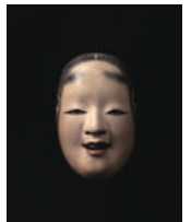
雪の小面 龍右衛門作 金剛家蔵

会期: 6月30日(土)~9月2日(日) 開館時間: 10:00~17:00 (会期中の金曜日は19:00まで)