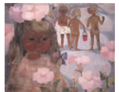
いわさきちひろ《ハマヒルガオと少女》1950年代中頃 ちひろ美術館蔵

会期: 7月14日(土)~9月9日(日) 開館時間: 10:00~18:00 (会期中の金曜日は20:00まで)