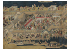
江戸名所図屏風(左隻部分) 江戸時代 重要文化財 出光美術館蔵

会期: 7月28日(土)~9月9日(日) 開館時間: 10:00~17:00 (会期中の金曜日は19:00まで)